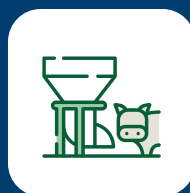
Alimentación de animales