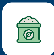
Abonos y fertilizantes