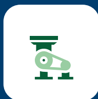
Productos de molienda