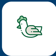
Sector avícola y huevos