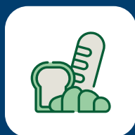
Productos de panadería