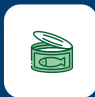
Preparaciones y conservas