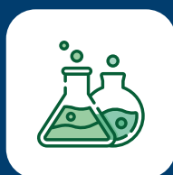
Productos químicos y minerales