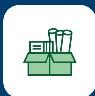
Cartón y papel